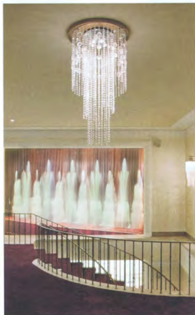
... verleiht dem Interieur ein mondänes Ambiente. • ... gives the interior a sophisticated ambience.