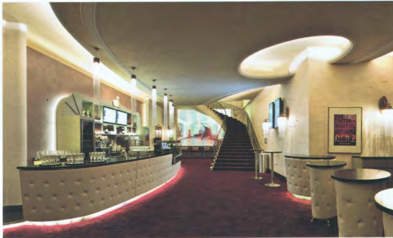
Die Kombination aus Stoffen, Farben und Beleuchtung ... • The combination of fabrics, colours and lighting ...

Entwurf • Design Anne Batisweiler, München