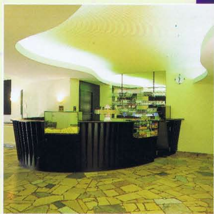
Das Foyer und der Saal 1 im „Gabriel Lichtspiele“ in München.

Nicht nur deswegen plädierte sie für den Erhalt des Bodens. Er ist, wie andere Details ein Bindeglied zur Geschichte des Hauses und zugleich