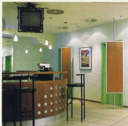
Das Foyer und der Saal 4 im Ambo, Stuttgart

tung zum Film sorgt und das Kino zum Teil der Film- und Traumwelt macht. Jenseits der Kino-Träume denkt die Innenarchitektin auch darüber nach, wie ein Haus zu Nebenzeiten einer zusätzlichen Nutzung zugeführt werden kann, ohne jedoch das klare Kino-Konzept