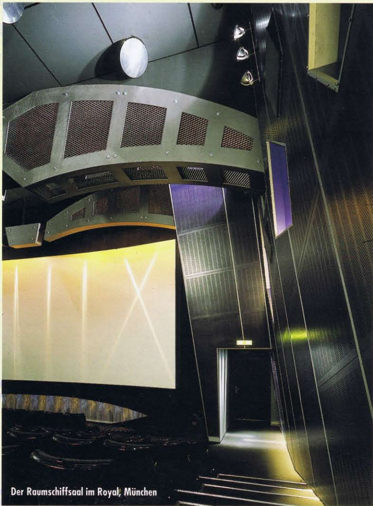
Der Raumschiffsaal im Royal, München

besonderer Ausdruck seiner Individualität. Auch die Decke aus den 60er Jahren wurde erhalten. Wie damals fällt auch heute das Licht durch die fächerartige Konstruktion, die sich an den Wänden fortsetzt und für Highlights sorgt. Die Mischung zwischen Bar, Café und funktionalem Foyer lockt auch Passanten an, die nur für einen Kaffee oder Snack hereinschauen.