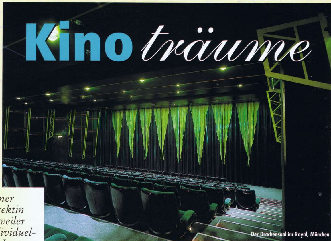
Der Drachensaal im Royal, München