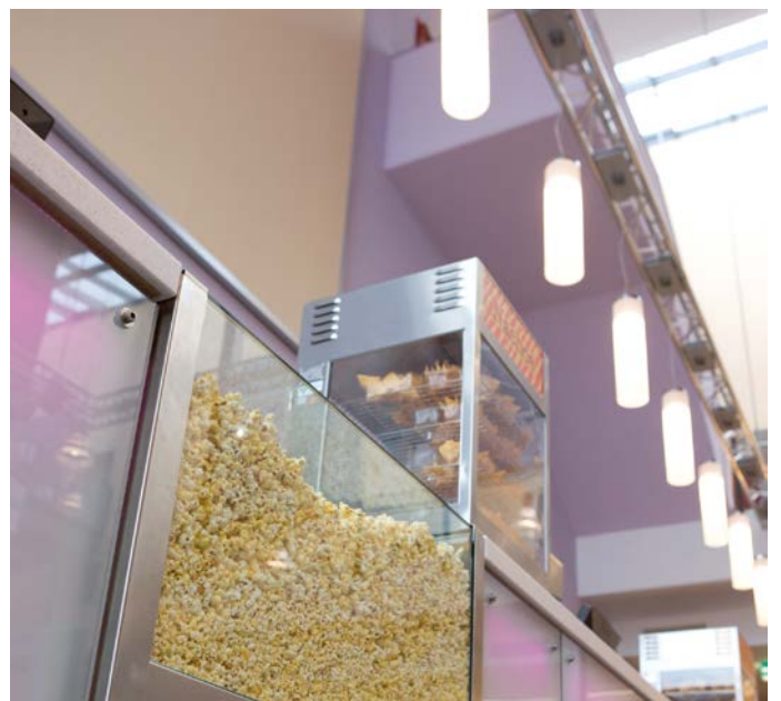
Abb.: »Das Popcorn soll nicht nur frisch und knackig sein, sondern auch so aussehen.«, so auch im Cineplex in Memmingen.